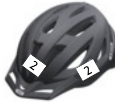
Helm vorne und hinten mit Startnummer bekleben