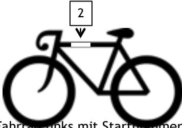
Fahrrad links mit Startnummer bekleben